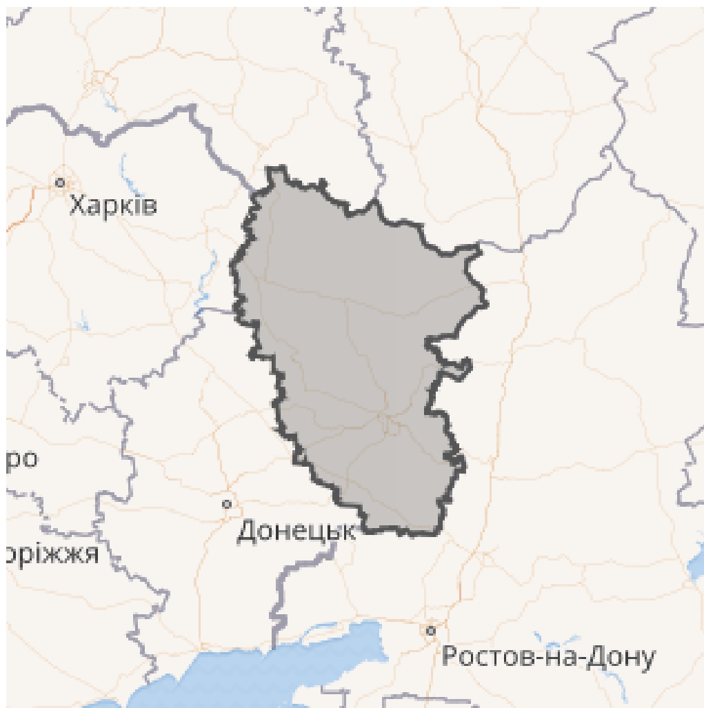
Рис. 1. Положення Луганської області на українсько-російському прикордонні

Для порівняння зазначимо, що в Донецькій області лінія фронту нині є більш вирівняною, і Костянтинівка, Краматорськ, Слов'янськ (попри безперервну небезпеку артилерійських ударів) дещо меншою мірою перебувають під загрозою російського захоплення порівняно з Лисичанськом або Сіверськодонецьком. Схема бойових дій і актуальна на момент підготовки статті лінія розмежування між контрольованою Україною й тимчасово окупованою рашистами територією представлені на рис. 2.